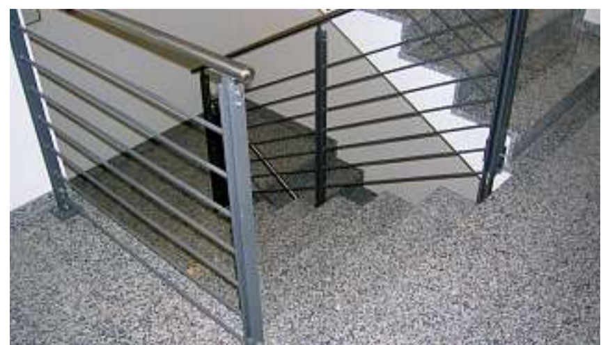
Mit Föhn-Treppen gelingt der Aufstieg!