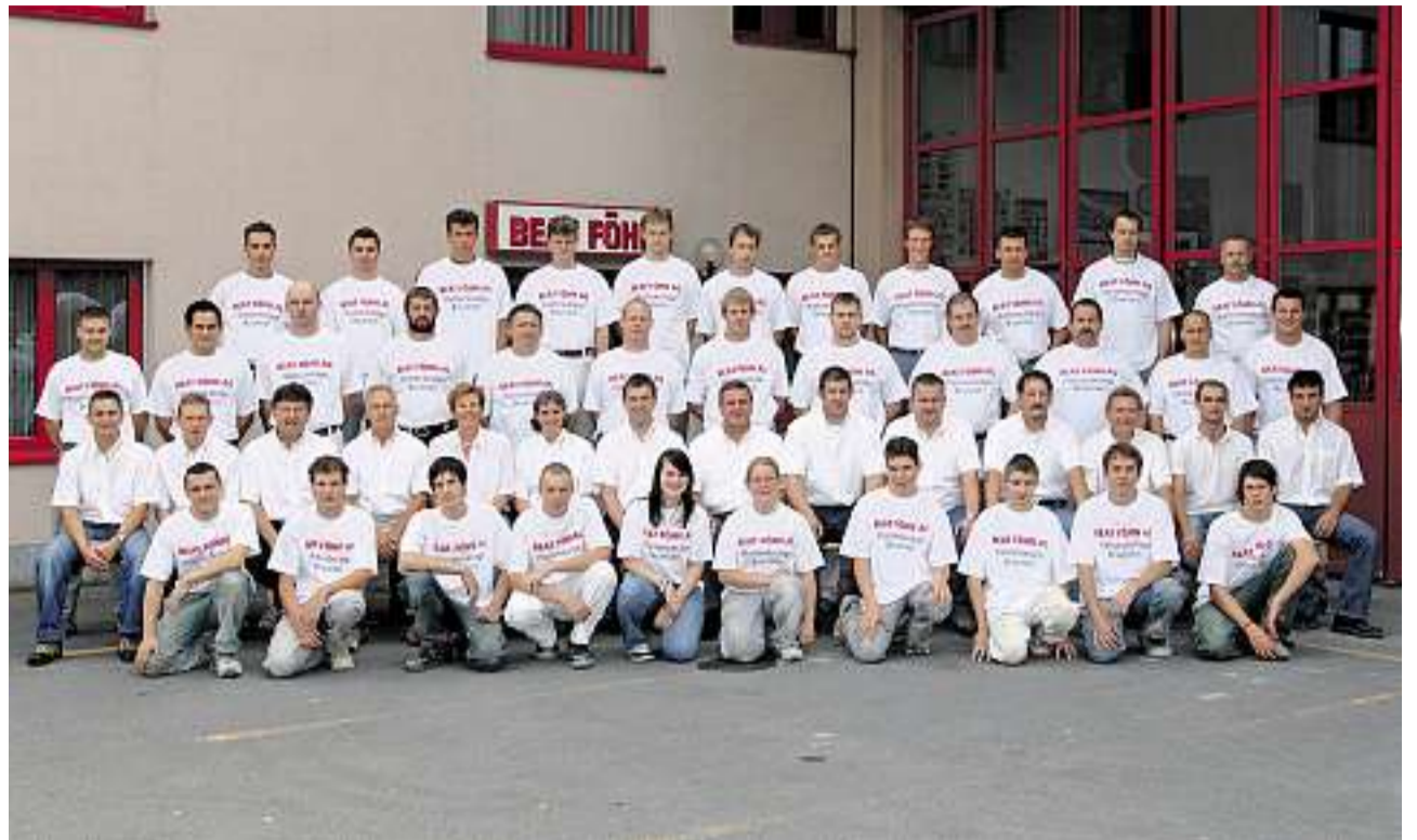
Der neue Geschäftsinhaber wird unterstützt von seinem Mitarbeiterstab.