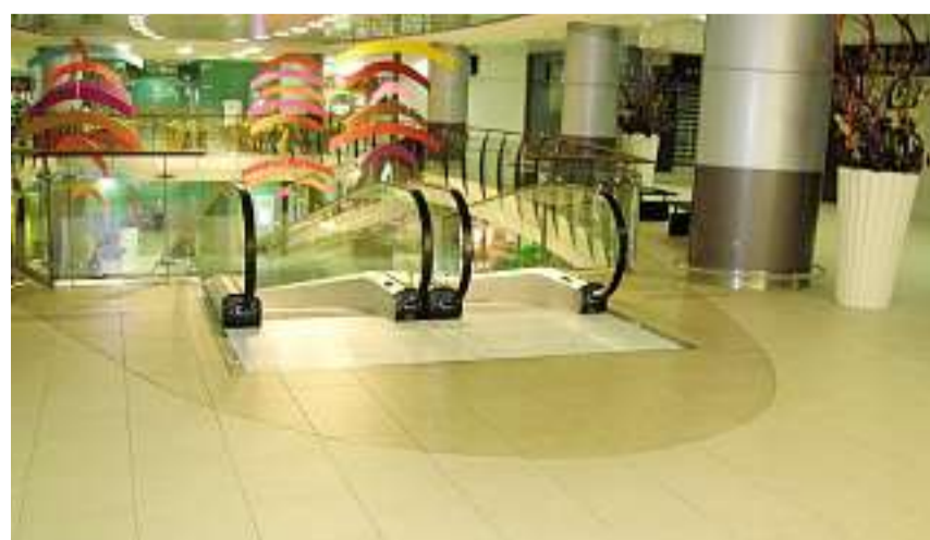
Eine saubere Arbeit ist der Stolz jedes Mitarbeiters.