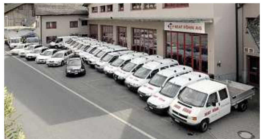
Der Fahrzeugpark: Die mobile Werbung.