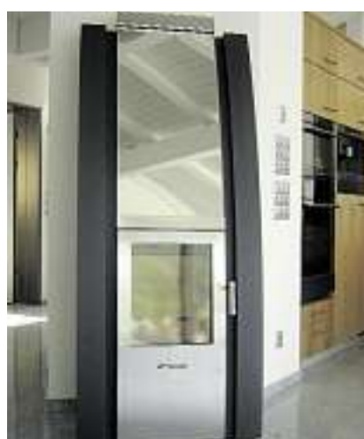
Nicht nur Wärme wird ausgestrahlt.